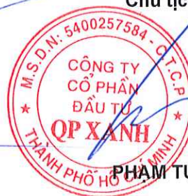
PHẠM TỰ TRỌNG