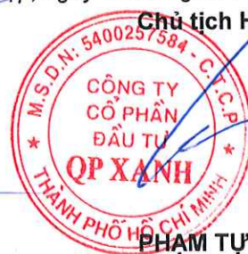
PHẠM TỰ TRỌNG